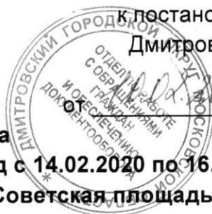
Схема размещения ярмарки в период с 14.02.2020 по 16.02.2020 по адресу: г.Дмитров, Советская площадь