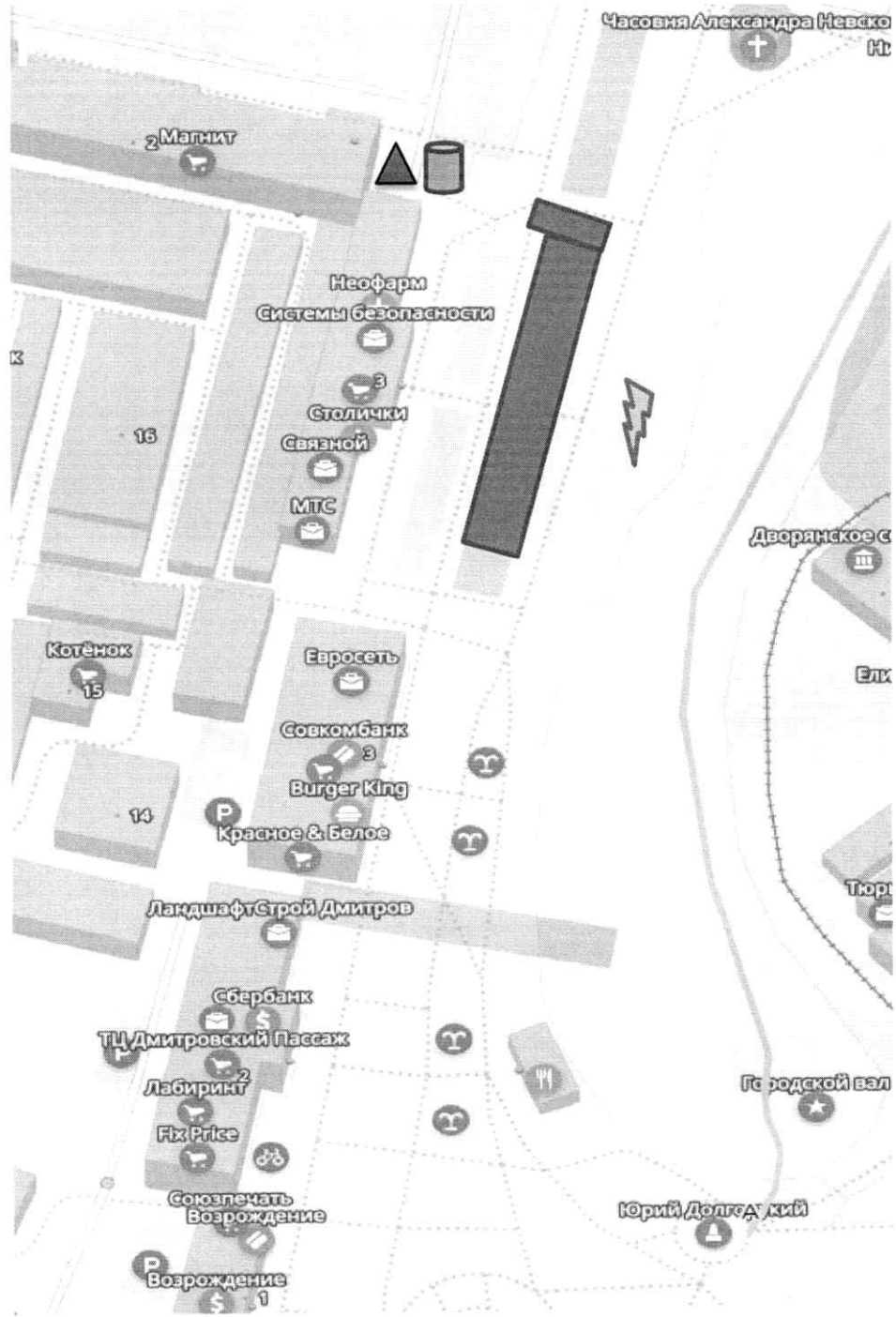
Схема размещения ярмарки в период с 17.02.2020 по 23.02.2020 по адресу: г.Дмитров, Советская площадь