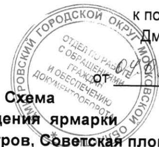
Схема размещения ярмарки по адресу: г.Дмитров, Советская площадь